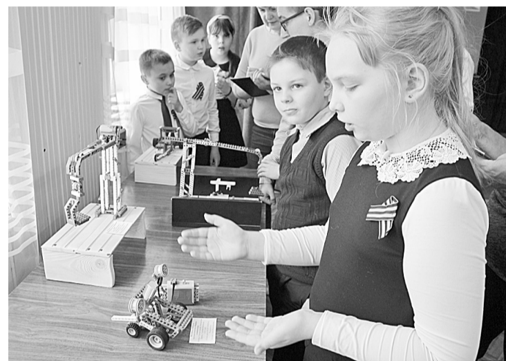
Участники фестиваля по легоконструированию не сомневаются в актуальности машин-роботов на производстве

Спонсорскую помощь и поддержку при организации фестиваля оказали ПАО «Мстатор», скаутская организация «Родник», Молодёжное конструкторское бюро.